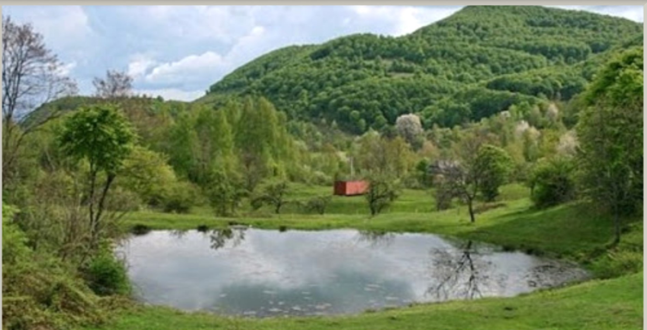
Hárspataki tengerszem.

Nagyon jó látni, hogy nemcsak a határon túliaknak fontos június 4-e, hanem az anyaországjaknak is: közös megemlékezéseket, programokat szerveznek összetartozásunk jeleként és kiállnak a határon túliak mellett. Ez minden határon túli embernek megerősítés. Törekedjünk tehát arra, hogy ez a dátum az emlékezetünkben legyen, ne merüljön feledésbe a múlt és összetartozásunk.