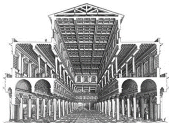
Basilica Ulpia (Traianus bazilikája)

A bazilikális tér évszázadokon keresztül meghatározta a keresztény szakrális építészetet. Az örmény és szír ókeresztények gyülekezeti templomaitól egészen az angol és francia gótikus katedrálisokig ez volt a domináns térformálása a templo-